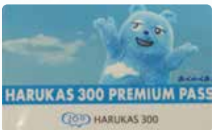
▲ハルカス年間パス ▼ハルカス屋上にて

そして息子に「二番目に好きなエレベーターは?」と尋ねると、「梅田スカイビルの三菱電機エレベーター。」と答えます。このエレベーターは、常用9人乗り分速45mで昇降しており、ハルカスと違い昇降中に外が見えるためすごく景色が良いエレベーターです。またエレベーターから話が逸ますが、梅田スカイビルは、空中庭園も素晴らしく季節ごとに色々なイベントも行われていますので興味がある方は調べてみてください。最近では、YouTubeでエレベーターが昇降しているだけの動画というものがUPされており、世界中色々なエレベーターが昇降している動画を息子は楽しそうに見ています。